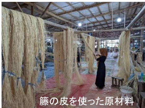
籐の皮を使った原材料

株式会社鹿田産業は、大正元年に福岡県八女郡広川町で創業しました。110年以上にわたる長い歴史と40年以上にわたるインドネシアとの輸入実績を有する弊社は、建築とインテリアデザインの新たな選択肢を提供するため、防災仕様のラタン編み生地「SHIKADA SHITSURAI R-TEXTURE」を発売いたします。