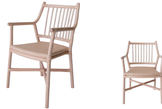
SDC04NA インテリア ダイニングチェア ¥70,000(税別)

組成 フレーム 藤皮つき藤100% 座面 ポリプロピレン100% サイズ 約W56×D57×H83×SH45 (cm) 重量 5.2kg 色 NA(ナチュラル) 原産国 インドネシア