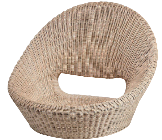
※写真にクッションはありませんが、円形クッションが付属します。