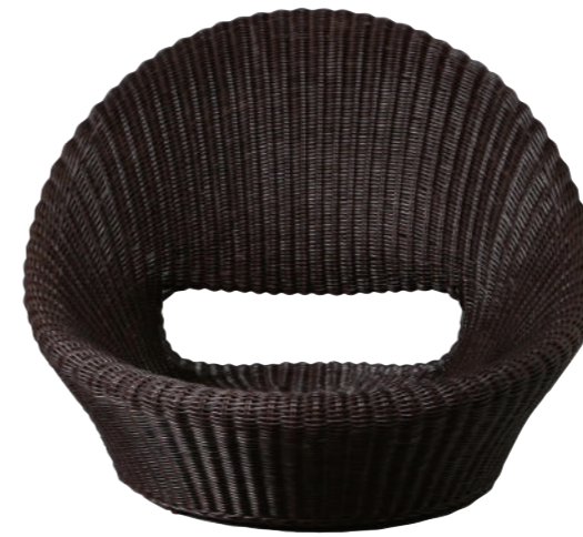
※写真にクッションはありませんが、円形クッションが付属します。

組成 本体 籐100% 台座 マホガニー材 色 BK(ブラック) ムートンカバー 羊毛皮100% サイズ 約W52×D160×H75×SH14~16 (cm) 原産国 インドネシア