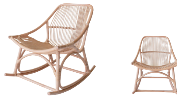
SRT01NA インテリア ロッキングテラスチェア ¥90,000(税別)

組成 藤100% サイズ 約W57×D57×H81×SH45 (cm) 重量 4.2kg 色 NA(ナチュラル) 原産国 インドネシア