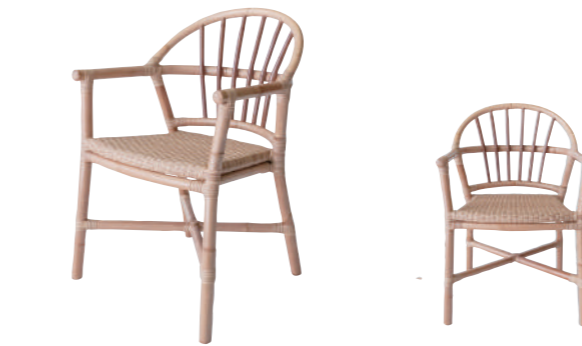
SDC02PNA アウトドア ダイニングチェア ¥85,000(税別)

組成 フレーム 藤皮つき藤100% 座面 ポリプロピレン100% サイズ 約W56×D57×H83×SH45 (cm) 重量 5.2kg 色 NA(ナチュラル) 原産国 インドネシア