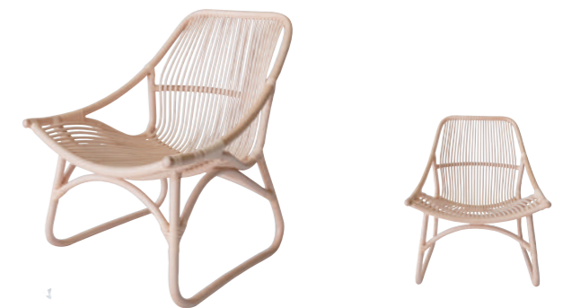
STC01NA インテリア テラスチェア ¥90,000(税別)

組成 フレーム 藤皮つき藤100% 天面 ポリプロピレン サイズ 約φ60×H46 (cm) 重量 5.7kg 色 NA(ナチュラル) 原産国 インドネシア