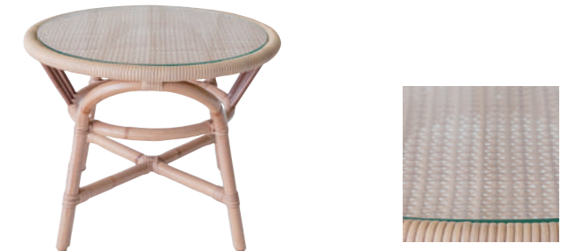
SDT02PNA アウトドア ガラストップテーブル ¥80,000(税別)

組成 フレーム 藤皮つき藤100% 座面 ポリプロピレン100% サイズ 約W57×D57×H81×SH45 (cm) 重量 5.0kg 色 NA(ナチュラル) 原産国 インドネシア