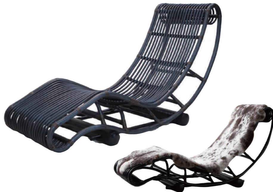
ムートンカバー付属

椅子全体を任意の角度に調整できます。 また台座から外すとロッキングチェアとしてもご利用できます。