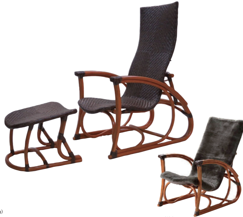
ムートンカバー付属

1976年からいち早く籐の原産地インドネシアの工場と提携、1985年には良質の天然素材を使った家具を開発しました。日本のデザイナーによるシンプルで個性ある椅子やテーブルは、モダンなデザインながら使い心地の良さを備えています