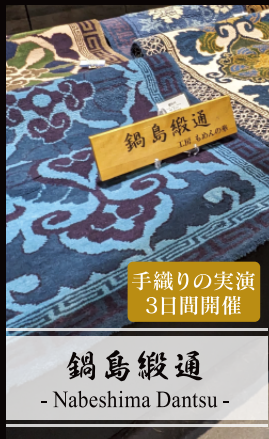
鍋島緞通 - Nabeshima Dantsu -